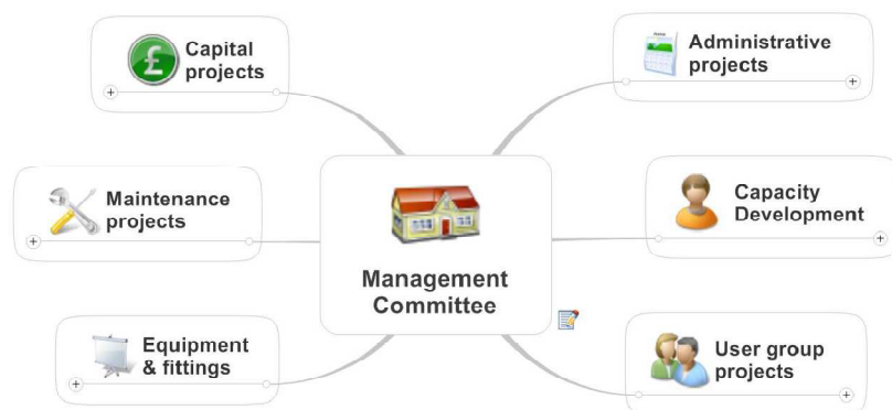
La map tableau de bord peut être organisée par thèmes

marqueur unique. Un exemple : « action en cours à terminer cette semaine ». S’il est vraiment pratique d’avoir instantanément une liste de choses à faire demain, le fait d’isoler la fonction « liste » libère pour ainsi dire la map et permet de l’organiser pour la parcourir de façon pertinente sans avoir à se soucier de réunir les éléments de même nature. Vous n’avez pas besoin dans votre map d’une branche pour les choses importantes – celles-ci seront visibles dans les Hot lists, quel que soit leur emplacement dans la map – ainsi vous pouvez vous concentrer sur l’organisation de la map par thèmes et par niveau de détail et ignorer tous les autres critères.